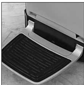
Cómoda plataforma ergonómica