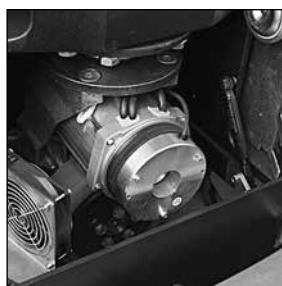
Potente motor AC