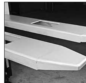
Horquillas de puntas redondeadas