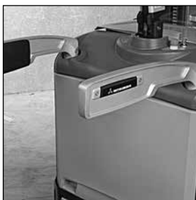
Barras laterales de seguridad acolchadas