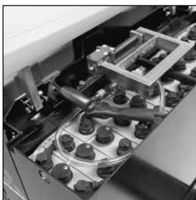
Baterías de gran capacidad