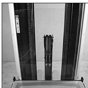
Mástil Panorámico para mayor visibilidad